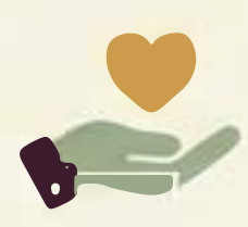
Figure Specialistiche: Supporto costante per il diritto allo studio.

Percorsi Personalizzati: PEI e attenzione ai Bisogni Educativi Speciali (BES/DSA).